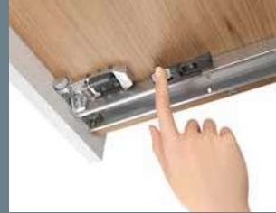
前後調整 *オプション +/-2mm