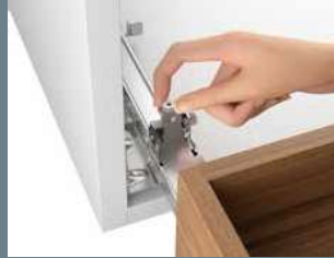
前後のアオリ調整 +4mm