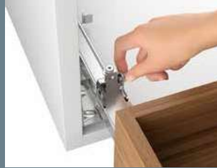
左右のアオリ調整*左レールのみ付属 +/-1.5mm